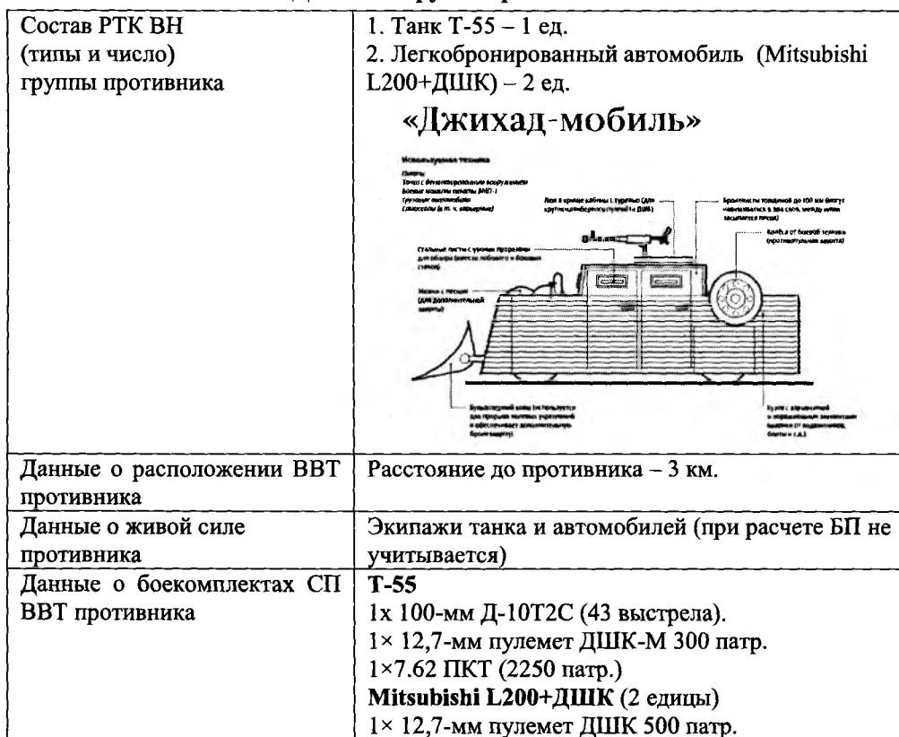
Данные о группе противника